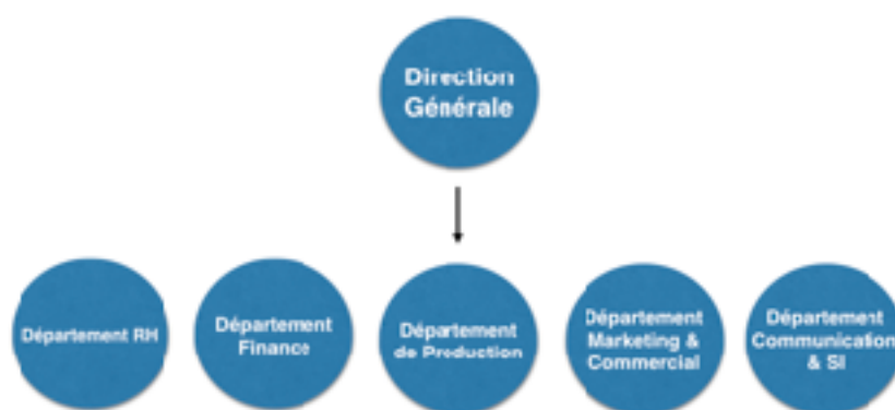
Organigramme de 3EA