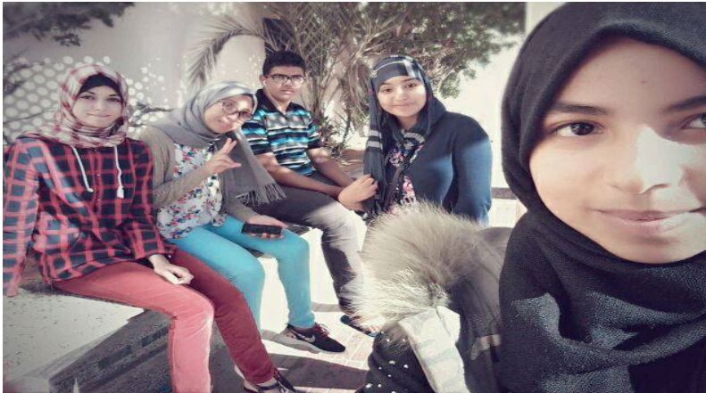
Membre de notre junior entreprise