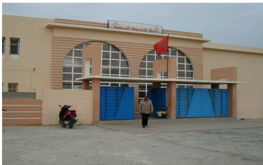
Notre lycée technique lala khadija